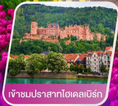
เข้าชมปราสาทไฮเดิลเบิร์ก