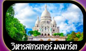
วิหารสกรเทอร์ มงมาร์ต