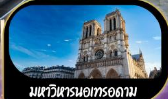
มหาวิหารนอทรอดาม