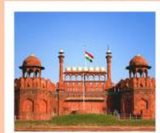
♥♥♥ Agra Fort