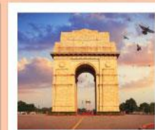
♥♥♥ India Gate