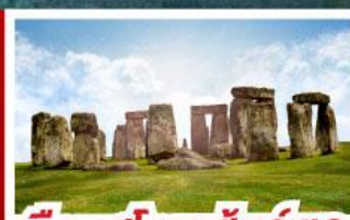
เฮือนสโตนเฮ็นจ์ และ พีพีร์กัทท์โรมันบาร