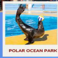
POLAR OCEAN PARK