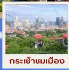
กระเช้าชมเมือง