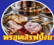
พรอยเซิร์ฟปิ้งย่างเกาหลี