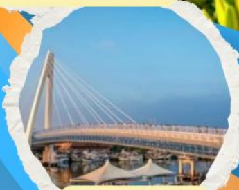
สะพานต้งซู้อู๋