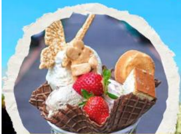
ร้านไอศกรีมมิยาฮาระ