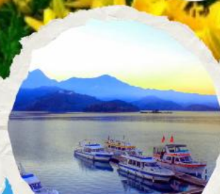
ทะเลสาบสุริยขึ้นจินฮารา