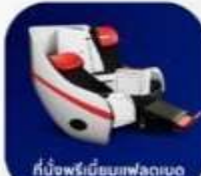
ที่นั่งพรีเมียมเฟลทเบด

บริการอาหารร้อน และ น้ำดื่ม บนเครื่อง ขาไป และ ขากลับ