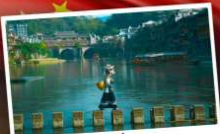
หมู่บ้านเฟิ่งทง

สุดคุ้ม!! พัก 5 ดาว ทุกคืน มนตร์เสน่ห์เมืองเก่า ริมสาងน้ำแจ่มใสแดน