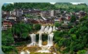
หมู่บ้านฟุทงเจิ้น