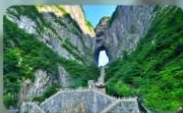
หุบเขาประตูสวรรค์