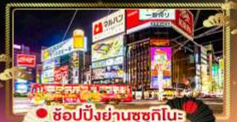
• ช้อปปิ้งย่านซูซุกิโนะ