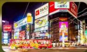
ซูปpingย่านซุซุกิโนะ