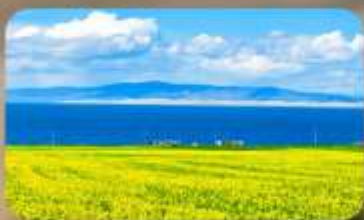
ทะเลสาบชิงไห่