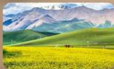
ทุ่งหญ้าซีเหลียน