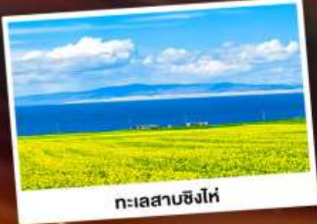
ทะเลสาบชิงไห่