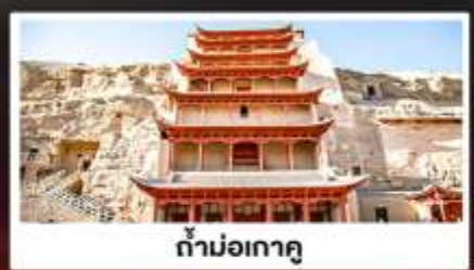
ถ้ำมอเกาตู