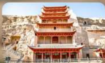
กำม่อเกาคู