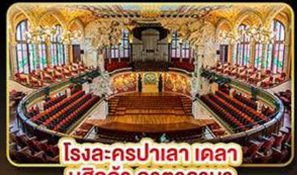
โรงละครปาเลา เดลา มูสิกา คาคาลานา