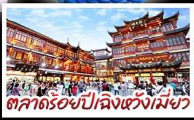
ตลาดร้อยปีเฉิงหวังเมี่ยว