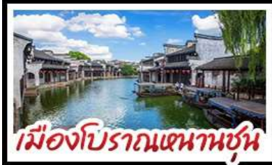
เมืองโบราณหนานชุน

DISNEYLAND SHANGHAI เต็มวัน เมืองโบราณหนานชุน (รวมล่องเรือ) - วัดจิ่งอัน เมืองโบราณหนานชุน - ตลาดร้อยปีเฉิงหวังเมี่ยว มือพิศข บุกพิศข BBQ, เสี่ยวหลงเปา