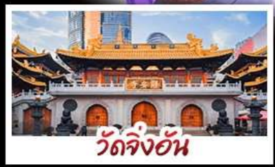
วัดจิ่งอัน