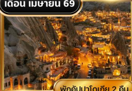
พักคัปปาโดเกีย 2 คืน