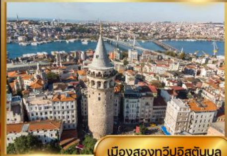
เมืองสองทวีปอิสตันบูล