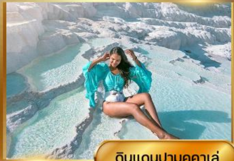
ดินแดนปามุคคาเล่