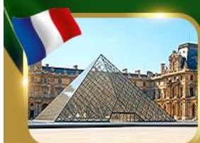
พีระมิดที่ลูฟวร์ ปารีส