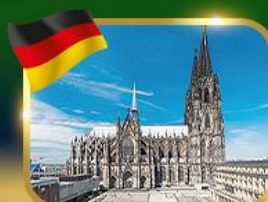
มหาวิหารแห่งเมืองโคโลญ