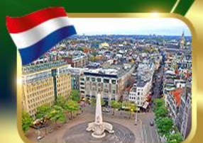
จัตุรัสดีนสแควร์ อัมสเตอร์ดัม