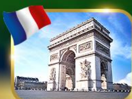
ประตูชัยฝรั่งเศส ปารีส