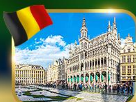
จัตุรัสกรอนด์ ปลาซ บริซเซลส์