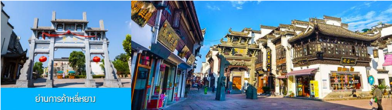
ย่านการค้าหลี่หยาง