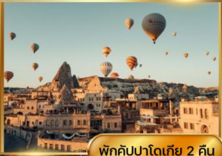
พิกคัปปาโดเกีย 2 คืน