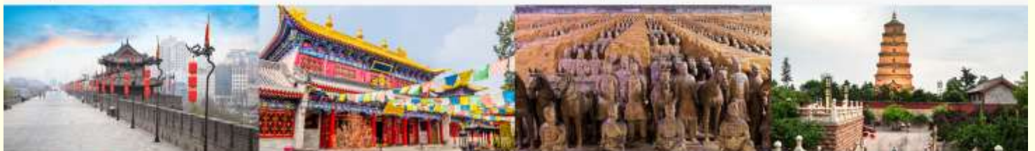
กำแพงเมืองโบราณ