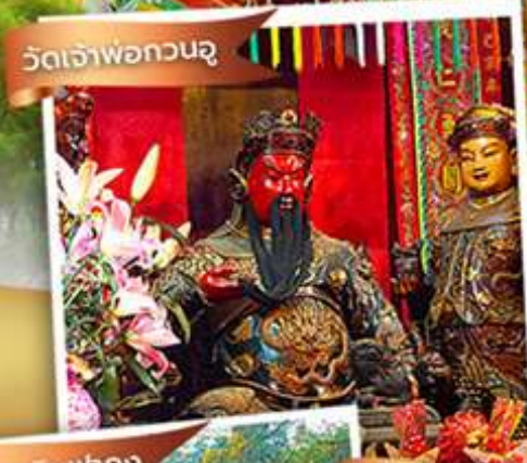
วัดหลินฟาง