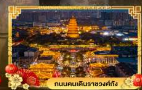
ถนนคนเดินราชวงศ์ถัง