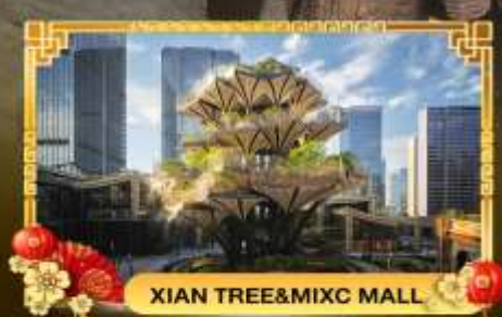
XIAN TREE&MIXC MALL