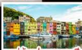
หมู่บ้านประมงหลากสี