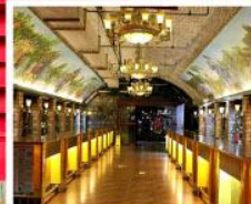
พิพิธภัณฑ์ไวน์ชิงเต่า