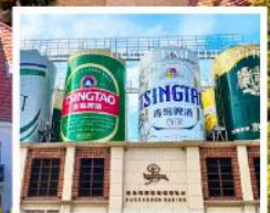
พิพิธภัณฑ์เบียร์ชิงเต่า