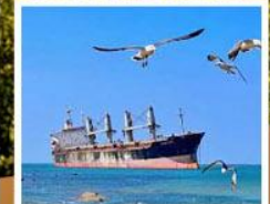
เรือสินค้าเกย์ตันบลูอิส