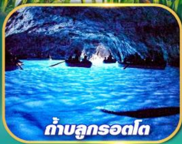
ถ้ำบลูกรอดโก