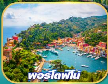
โพซิโตฟิโน