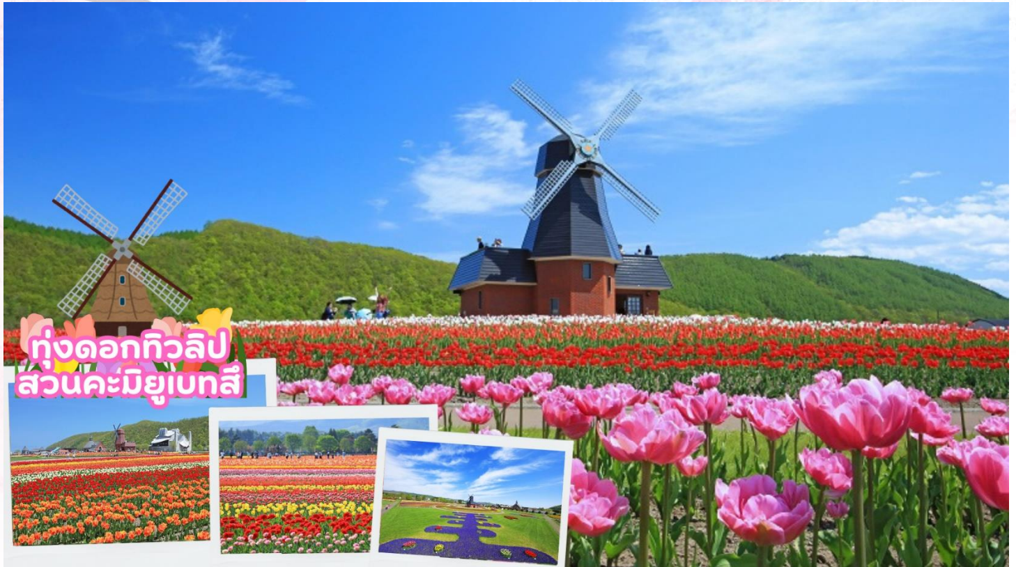
ทุ่งดอกทิวลิป สวนคะมิยูเบทสึ

จากนั้นนำท่านชมทุ่งดอกทิวลิป ณ สวนคะมิยูเบทสึ (Kamiyubetsu Tulip Park) จากสวนดอกไม้เล็ก ๆ ที่ถูกสร้างขึ้นโดยคนท้องถิ่นเพื่อสืบทอดดอกทิวลิป [ดอกไม้ประจำเมือง] ไปสู่รุ่นต่อไป และได้พัฒนา มาเป็นอุทยานทิวลิปคะมิยูเบทสึ ปัจจุบันอุทยานแห่งนี้มีดอกทิวลิปสีแสนสดใส กว่า 1,200,000 ดอก จาก กว่า 120 สายพันธุ์ ที่จะบานทั่วทั้งสวนในฤดูใบไม้ผลิ [ขึ้นอยู่กับสภาพอากาศ]