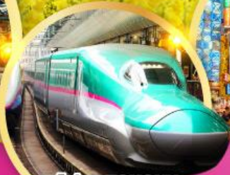
รถไฟ JR TOHOKU SHINKANSEN LINE

ชมทุ่ง ดอกเรพซิด สวนดอกไม้ ะคุโร การ์เด็น