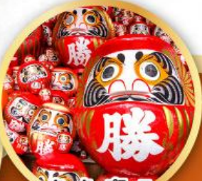
วัดคัตสึโองิ (วัดदारุมะ)

ชมความงามของกำแพงหิมะ เส้นทางสายอัลไพน์ ทากายามา (JAPAN ALPS SNOW WALL)