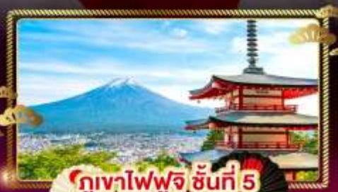
ภูเขาไฟฟูจิ ชั้นที่ 5

ชมลาวนเดอร์ ที่ สวนโออิชิปาร์ค อิสระ 1 DAY TRIP