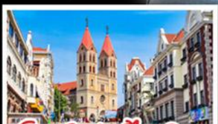
โบสถ์เซนต์ไมเคิล