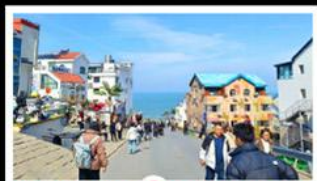
ถนนคอปเพิลิงหมายเลข 8

สัมผัสความยิ่งใหญ่ของ 4 เมืองสำคัญ ชิงเต่า - เยียนโก - เฟิงไห่ - เว่ยไห่ ปาต้ากวน - โบสถ์คาทอลิก - ตึกเก่าริมหา