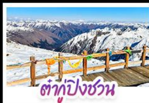
ต้ากู่ปิงชวน