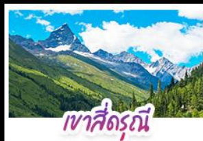
เขาสี่ดรุณี