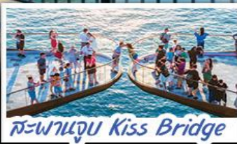
สะพานจูบ Kiss Bridge