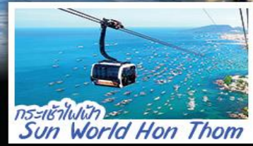
กระเช้าไฟฟ้า Sun World Hon Thom