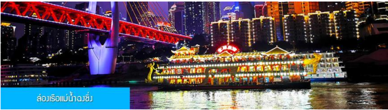
ล่องเรือแม่น้ำฉางชิ่ง