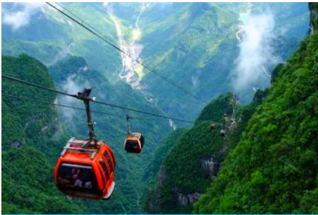
เขาเจ็ดดาว

เที่ยง รับประทานอาหารกลางวัน ณ ภัตตาคาร *บุฟเฟ่ต์หมูย่างเกาหลี (8)