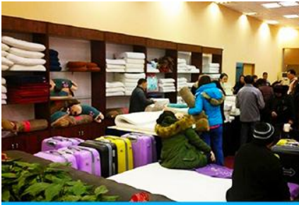
ศูนย์จำหน่ายผลิตภัณฑ์ยาวพารา