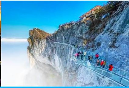
ระเบียงทางเดินกระจกเลียบนหน้าผา