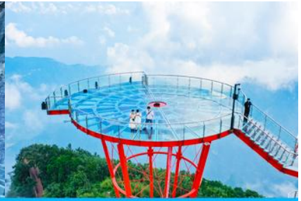
ระเบียงชมวิว Sky Eye

วันที่สี่ พิพิธภัณฑภาพเขียนหินทราย-ศูนย์ผลิตภัณฑ์ที่ทำจากยางพารา – กระจ่าขึ้นเขาเจ็ดดาว – ระเบียงแก้วเลียบนหน้าผา ระเบียงชมวิว SKY EYE – (ไกด์นำเสนอโปรแกรมเสริม ชุดโชว์จิ้งจอกขาว)