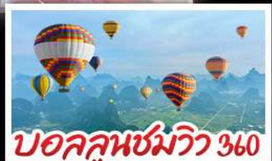
บอลลูนชมวิว 360