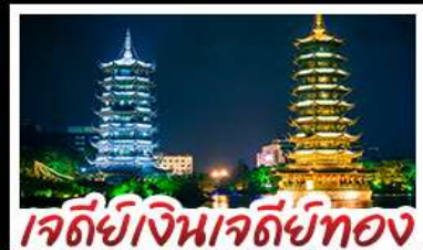
เจดีย์เงินเจดีย์ทอง

ล่องแพไม้ไผ่ แม่น้ำหลี่เจียง - ภูเขาหู่ยี่ กระเช้า ไปกลับ บ้านบันไดหลงเซิน - เจดีย์เงินเจดีย์ทองวิวิค้ำ เขาวงซ้าง - บอลลูนชมวิว 360 ambuพิศษ บูฟฟิตนึ่งย่างบาร์บีคิว ปลาอบเบียร์ ฝือกคริสตล สุกี้หืด