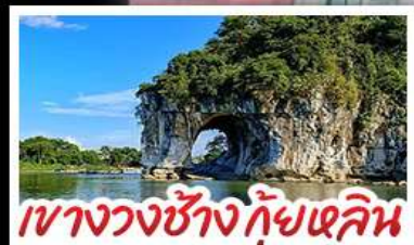
เขาวงซ้างกึ่งแกลิน