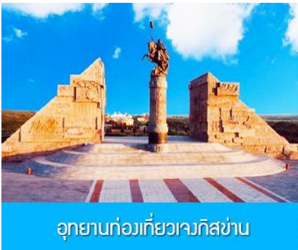
อุทยานทองเทียวเจงกิสข่าน

รับประทานอาหารกลางวัน ณ ร้านอาหารพื้นเมืองในเขตอุทยาน (11)