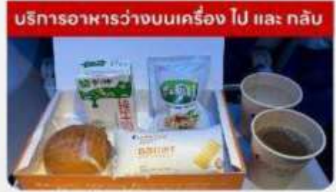
บริการอาหารว่างบนเครื่องบิน ไป และ กลับ