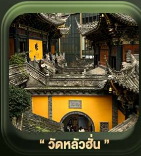
“ วัดหลัวอัน ”