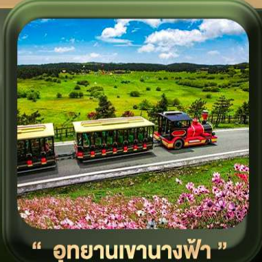
“ อุทยานเขานางฟ้า ”

T2G-CKG26CZ Special of Chongqing... วงซิ่ง ต้าจู้ อุ้หลง อุทยานหลุมฟ้า เขานางฟ้า 5D 3N (CZ)