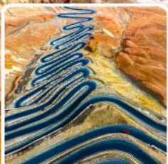
ถนนผานหลงกู่ต้าว