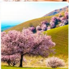
ทุ่งดอกอัลมอนต์