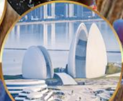
โรงละครหอยโข่มุก