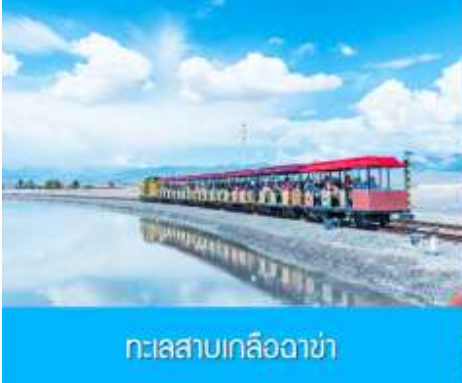
ทะเลสาบเกลือฉาซ่า

เช้า รับประทานอาหารเช้า ณ ห้องอาหารของโรงแรม (1) หลังอาหารเช้าท่านเดินทางโดยรถบัสสู่ทะเลสาบฉาซ่า (ระยะทาง 289 กม.ใช้เวลาเดินทางราว 3 ชั่วโมงเศษ) เที่ยง รับประทานอาหารกลางวัน ณ ภัตตาคาร (2)