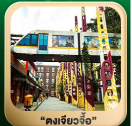
“ดงเจียวจื่อ”