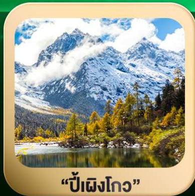
“ปี่ฝิงโกว”

ชมธรรมชาติ 2 อุทยานขึ้นชื่อ อุทยานภูเขาสี่ครุณี + อุทยานปี่ฝิงโกว สะพานหนานเฉียว • ถนนคนเดินไท่กู่หลี่ + ซุนซีลู่ + Pop Mart • ดงเจียวจื่อ