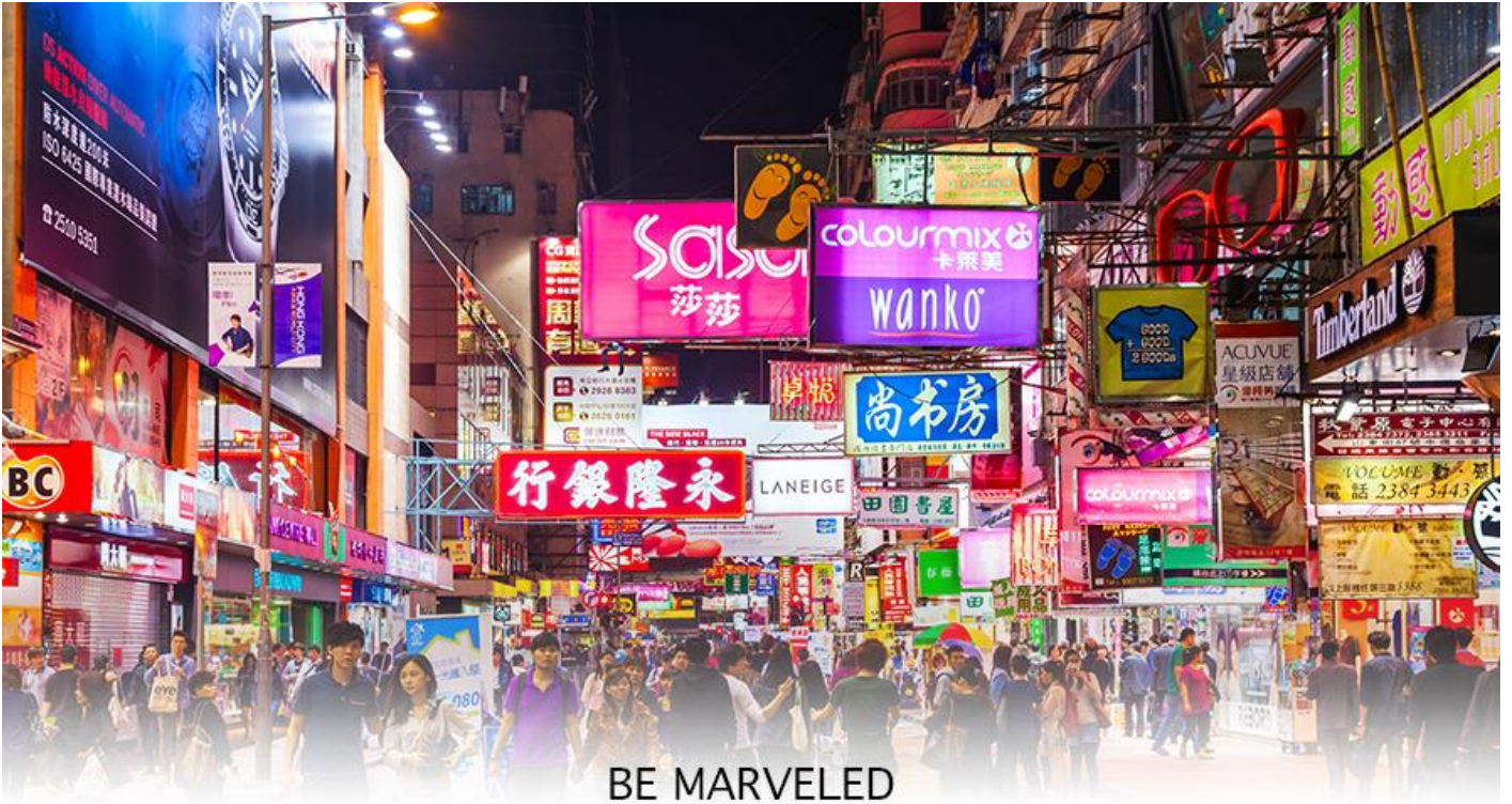
BE MARVELED TSIM SHA TSUI