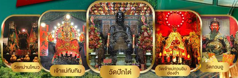
วัดบ้านใหม่