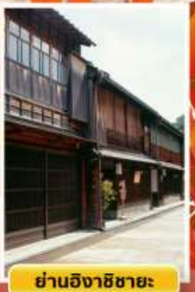
ย่านอิงาชิซายะ