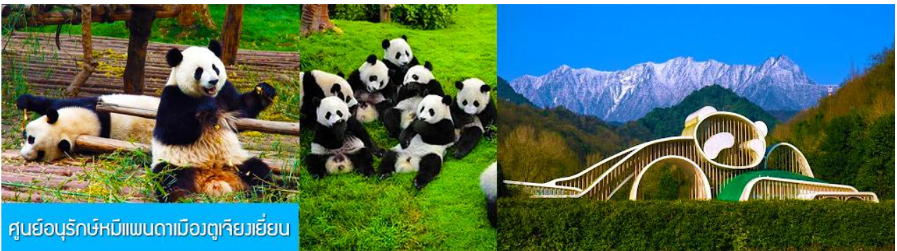
ศูนย์อนุรักษ์หมีแพนดามีวตุเจียงเวียน