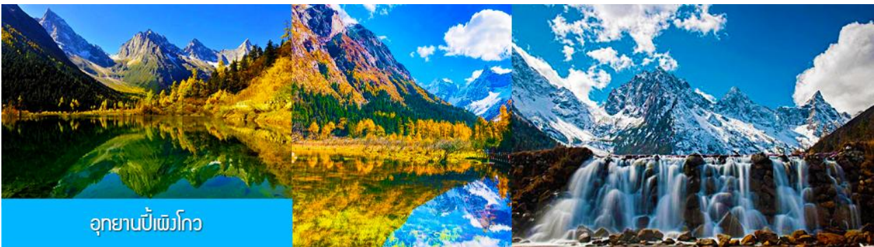
อุทยานปีศาจโกว