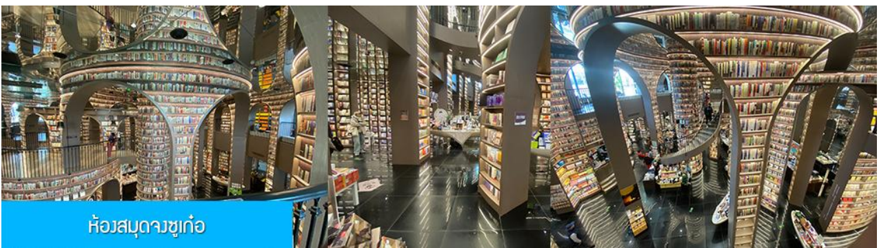
ห้องสมุดวงจุก่อ

พักที่ โรงแรม MINGZHISHANGCHUN HOTEL ระดับ 4 ดาวท้องถิ่นหรือเทียบเท่าในเมืองคูเจียงเวียน