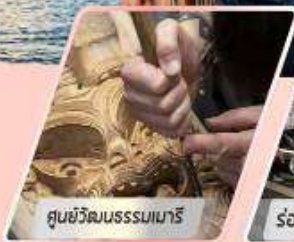
ศูนย์วัฒนธรรมเมารี