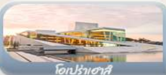
โอปราเฮาส์

เดินทาง 11-19 มิ.ย. 69 / 23-31 ก.ค. 69 / 05-13 ส.ค. 69 03-11 ก.ย. 69 / 24 ก.ย.-02 ต.ค.69