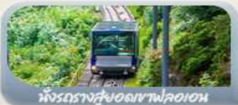
นั่งรถรางสวยอดเขาฟลอมอน