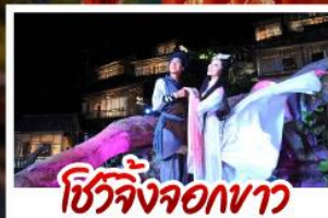
ซีวี่จิ้งจอกขาว