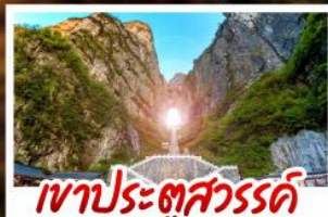
เขาประตูลี้สวรรค์