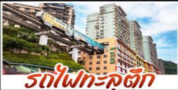
รถไฟฟ้าสุดคึก