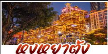
แสงยามค่ำคืน

สัมผัสประสบการณ์เที่ยวจีนแบบเต็มอิ่ม ทั้งความล้ำสมัยของมหานครฉงชิ่ง และความงดงามตระการตาของธรรมชาติที่จุหลอง ทุกการเดินทางเต็มไปด้วยความสะดวกสบายและคุ้มค่าที่สุด! ทุกการเดินทางเต็มไปด้วยความสะดวกสบายและคุ้มค่าที่สุด!