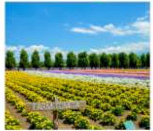
ทุ่งลาเวนเดอร์โทมิตะ