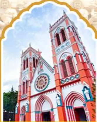
ปอนตีเชอร์