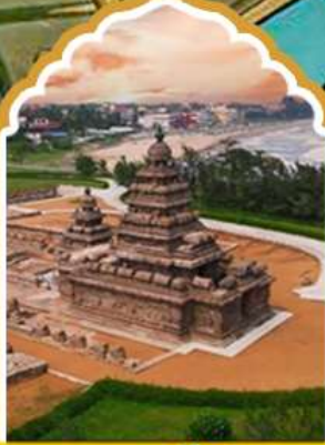
มหาบาลีปุรัม