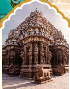
กาญจีปุรัม