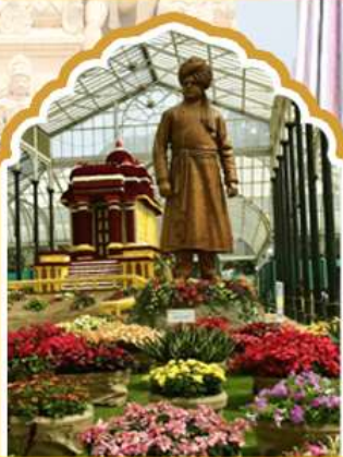
บังกาลอร์