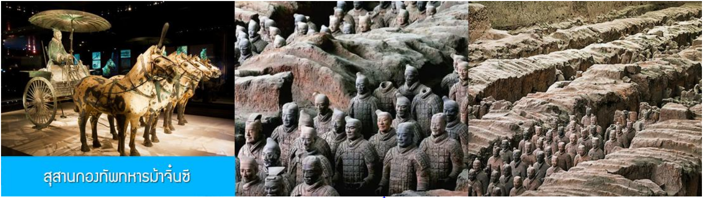
สุสานกองทัพทหารม้าจีนซี