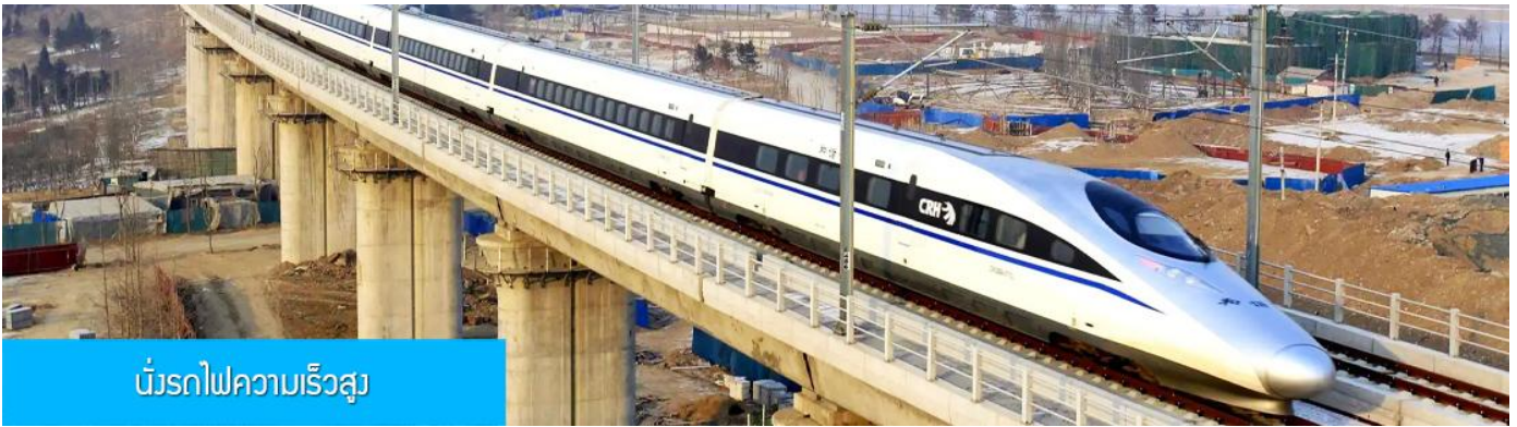
บริการรถไฟความเร็วสูง

หลังอาหารนำท่านเดินทางสู่สถานีรถไฟความเร็วสูงนครซีอาน เพื่อเตรียมเดินทางสู่นครฉว่หยาง