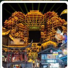
ตึกหอคจรรย 72